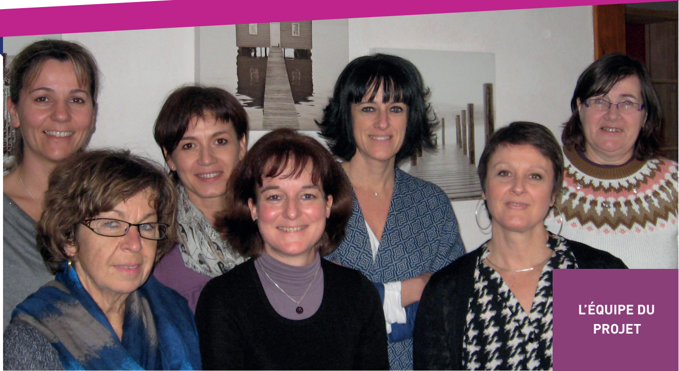
L'ÉQUIPE DU PROJET